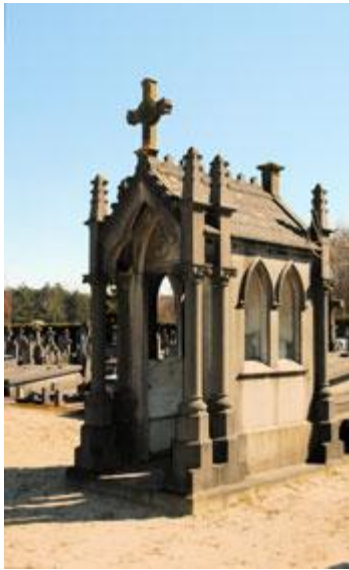
Bergen op Zoom: grafkapel voor de familie Bastiaanse-Fontijn

en de entreepartij in de vorm van een tempelfront (Romein). Neogotisch is de grafkapel voor de familie Bastiaanse-Fontijn (circa 1894) op het rooms-katholieke deel van begraafplaats Mastendreef in Bergen op Zoom. Karakteristiek zijn de spitsboogvormen en zuilen met pinakels (decoratieve beëindiging van pijlers).