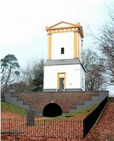
Leersum: mausoleum van Nellesteyn

De 19de eeuw is de eeuw van de neostijlen, stijlen die teruggrijpen op de klassieke Oudheid. De vormgeving van veel mausolea en grafmonumenten uit die tijd is geïnspireerd door de bouwkunst van Grieken, Romeinen en Egyptenaren.