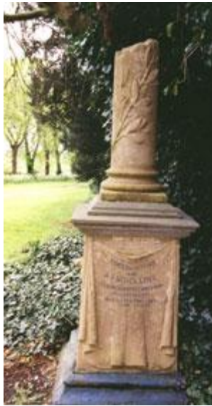
Oudekerk aan de IJssel: zuil op sokkel